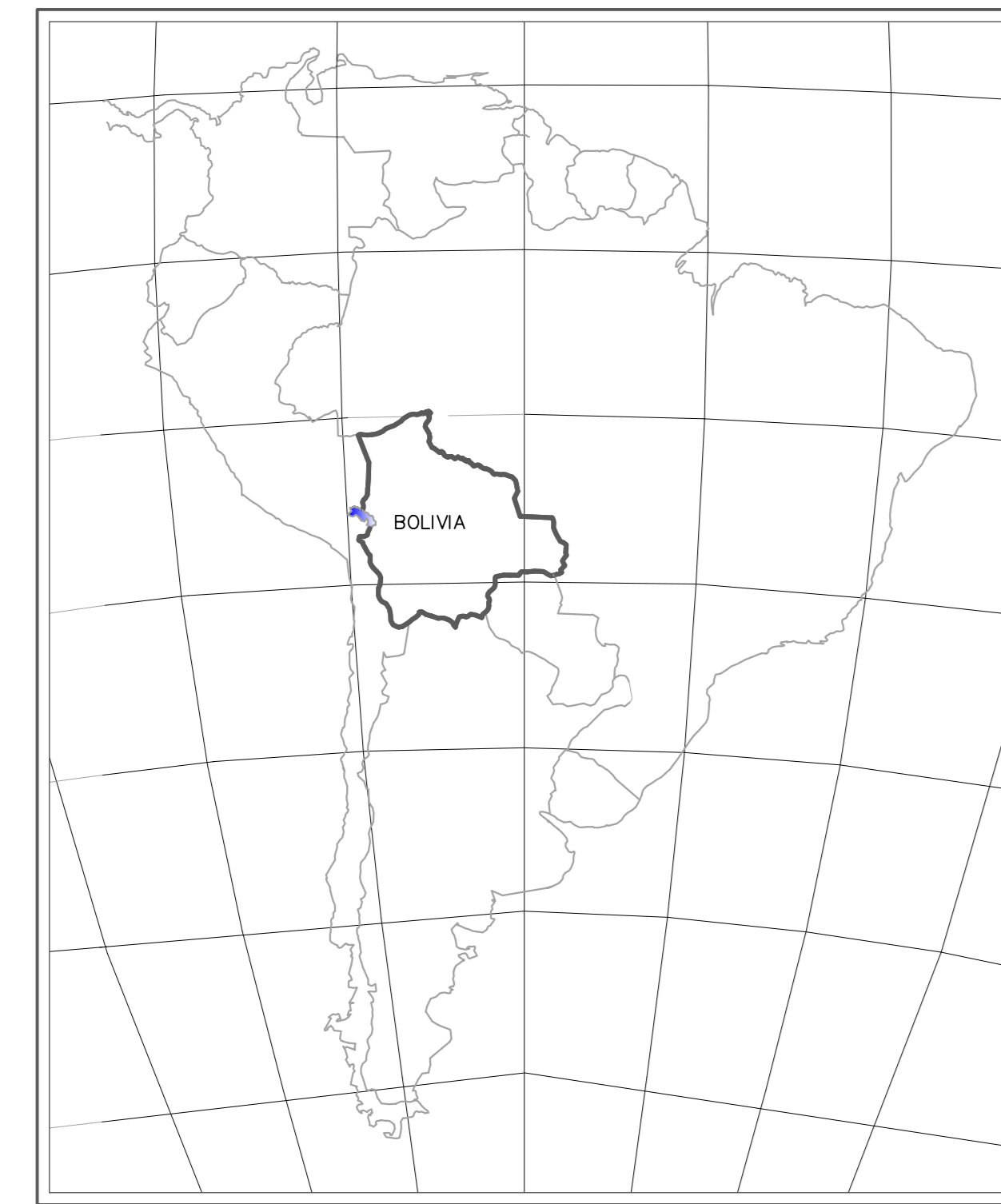
UBICACION ESTADO PLURINACIONAL DE BOLIVIA