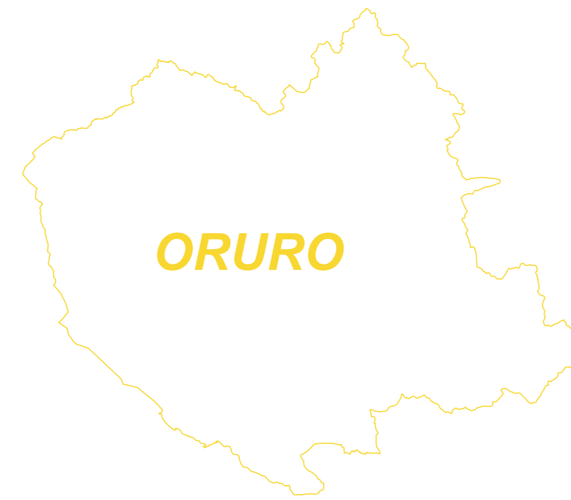
Plano de Ubicación LOCALIDAD CAÑO HUMA